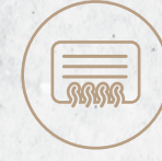
مكيفات مخفية Concealed air conditioners