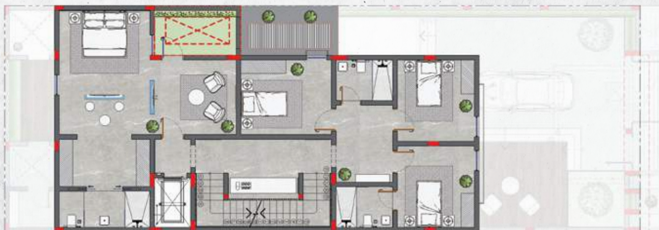
الدور الأول | الفيلا العادية | FIRST FLOOR | INNER UNIT |