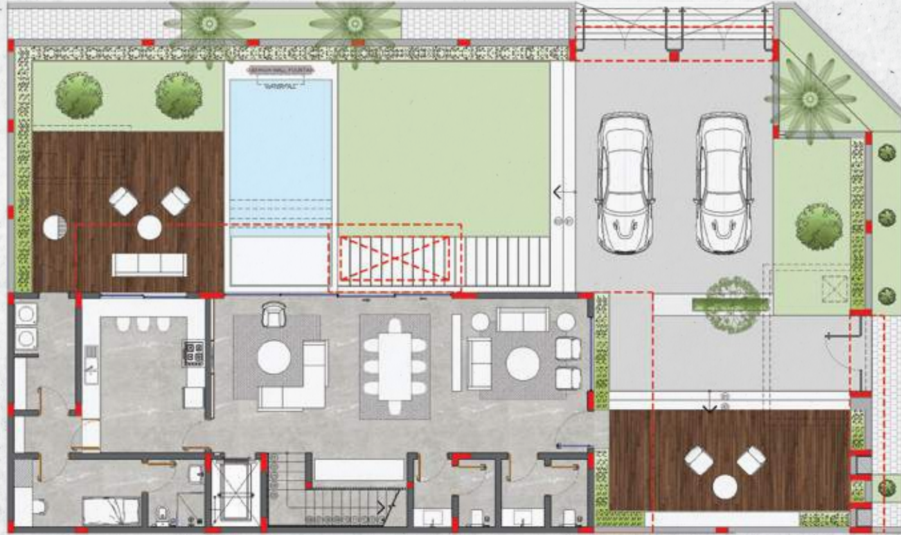
الدور الأرضي | فيلا الزاوية | GROUND FLOOR | CORNER UNIT |