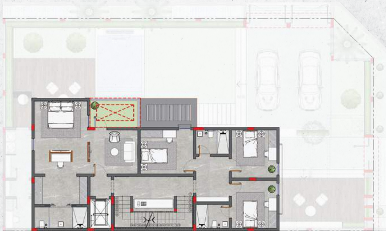
الدور الأول | فيلا الزاوية | FIRST FLOOR | CORNER UNIT |