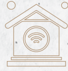
فيلا ذكية Smart Villa