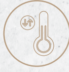
حساس جو Atmospheric Sensor