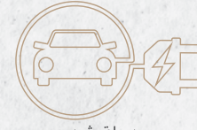
محطة شحن سيارة كهربائية Charging station for electric vehicles