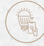
إضاءة ذكية Smart Lighting