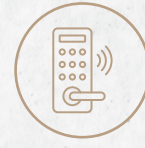
دخول ذكي Smart Entrance