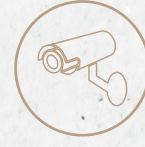
كاميرا مراقبة Surveillance Camera