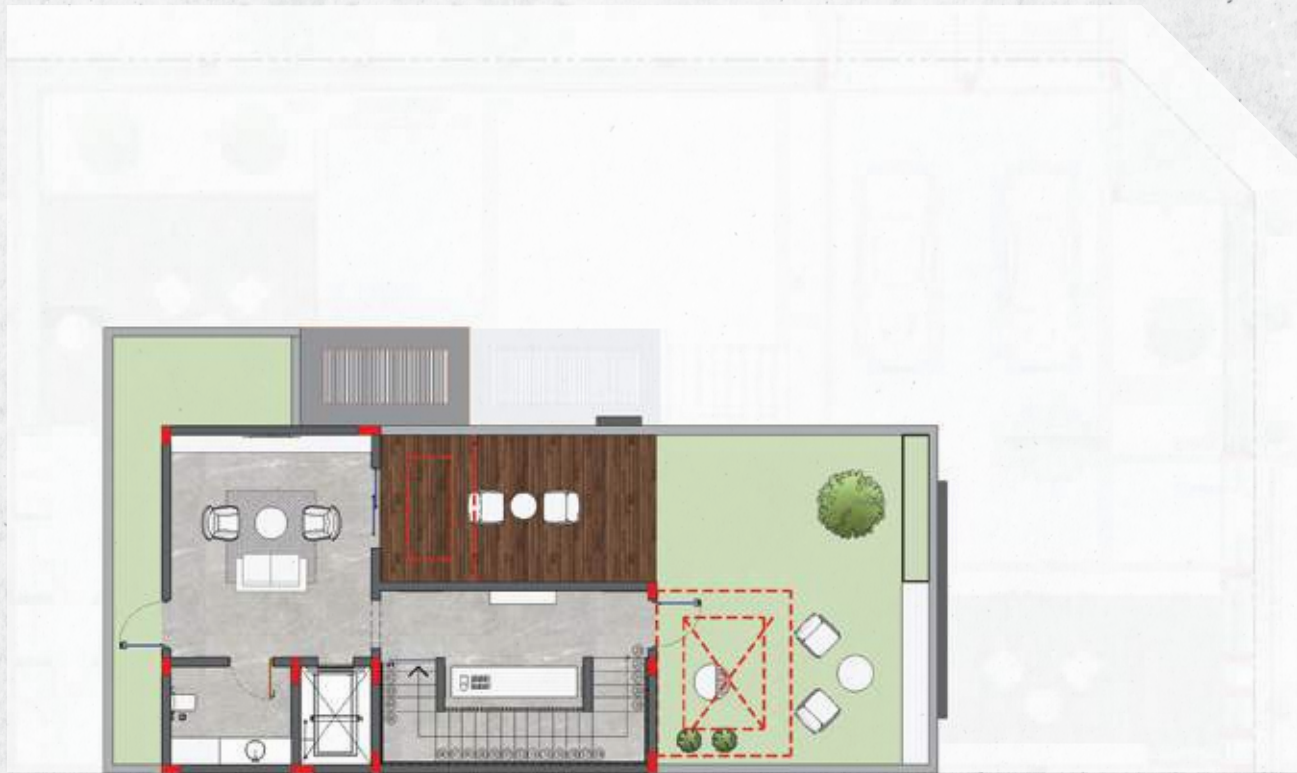
الدور العلوي | فيلا الزاوية | SECOND FLOOR | CORNER UNIT |