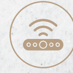
مستشعر حركة Motion Sensor